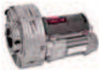
WINNER PRO 600/240