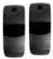
Fotocélula X04 Photocell X04 Photocellule X04