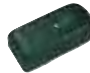
Electrocerradura P-18 Electric lock P-18 Électroserrure P-18