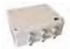
AX -230 AX -230 AX -230