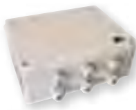
AX -230 AX -230 AX -230