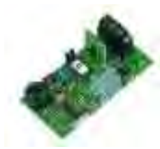
Tarjeta TRV VARIOCODE Scheda TRV VARIOCODE Cartão TRV VARIOCODE