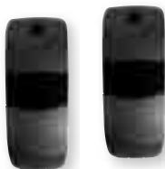
Fotocélula X04 Fotocellula X04 Fotocélula X04