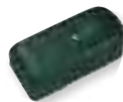
Electrocerradura P-18 Elettroserratura P-18 Fechadura eléctrica P-18